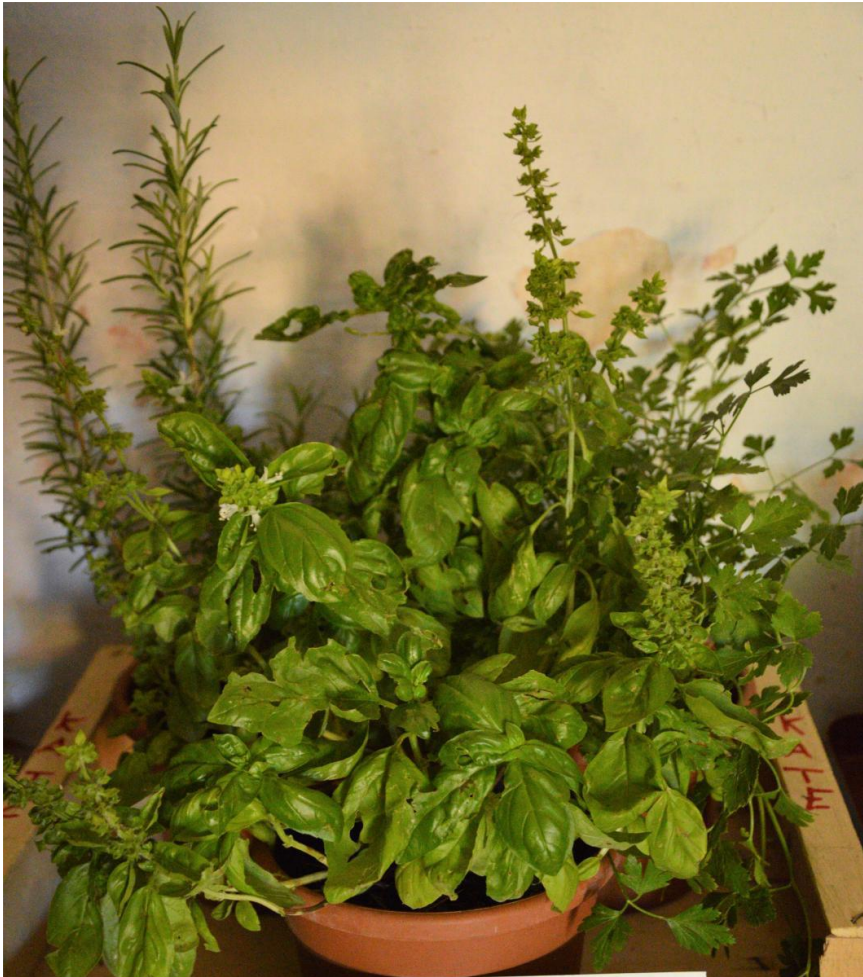
L'ORTO DI KATE