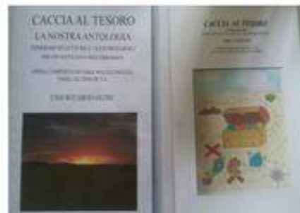
Le loro Antologie

Anche oggi i romanzi, le novelle, le poesie esigono una voce, desiderano una loro fisicità. E questo avviene in un faccia a faccia, che è quello dell'insegnante coi ragazzi, che riporta ad un altro faccia a faccia con l'autore e, a volte, ad un faccia a faccia con se stessi.