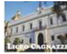
Liceo classico Luca de Samuele Cagnazzi